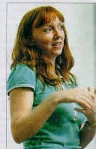
La artista Susan Philipsz.

La primera intervención de Susan Philipsz será sobre el sonido. «Es una persona que trabaja sólo con sonido y teniendo en cuenta el canto, que la música es tan importante, creemos que era fundamental empezar esa nueva fase con un artista que más que trabajar con elementos plásticos trabaja justamente con lo inmaterial, lo espiritual y con el sonido que es