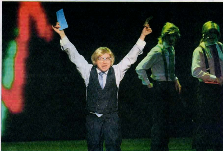
Uno de los cuatro tiburones de las altas finanzas que protagoniza 'Brokers' incita al público a sumarse al furor que invade el parque bursátil.