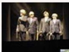
Yllana en Ainsa cosechó anoche un gran éxito.

25/07/08.- La compañía teatral cosechó un gran éxito ante el millar de espectadores que siguieron el espectáculo. Esta noche Joaquín Pardinilla Quinteto y Miguel Gil & Orquesta Árabe de Barcelona, interpretarán un doble concierto. Mañana sábado, las músicas castellana de "La Musgaña" y portuguesa de los Gaiteros de Lisbora protagonizarán el último concierto del Castillo.