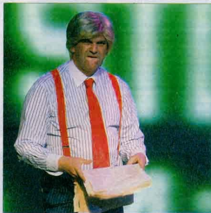
Los ejecutivos, impecables, se ganaron el aplauso del respetable.